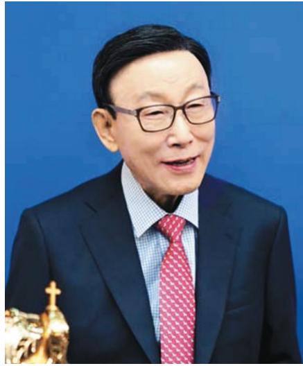
DCEM 총재 조용기 목사

사람은 생기가 있어야 기쁘고 행복합니다. 기가 빠진 사람은 기쁨이 떨어진 자동차 같아서 모양은 근사해도 쓸모가 없습니다. 그러면 어떻게 해야 우리가 생기가 넘치는 삶을 살 수 있을까요?