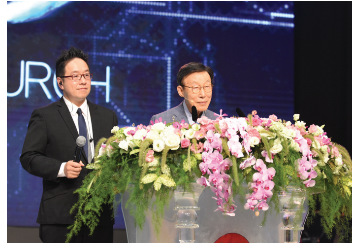
9월 대만성회 1