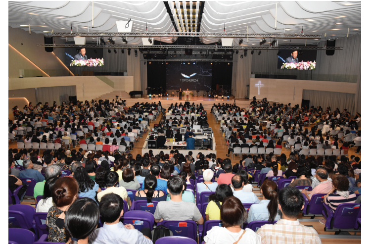
9월 대만성회 2